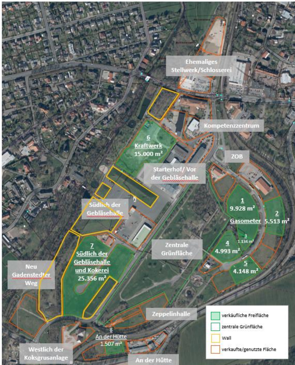
Abbildung 2: Übersicht Gigapark+

Lage (Bitte verorten Sie die Lage der gewünschten Flächen, geben Sie hierzu die zutreffende Nummer auf der Karte an 1-8): _____